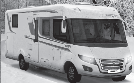
Rapido 2020 mer skandinavisk enn aldri før

* Se detaljer for hver modell i den tekniske guiden. Vekten som er oppgitt i de tekniske spesifikasjonene for dette utstyret er ikke inkludert i kjøretøys tomvekt og skal trekkes fra nyttelasten.